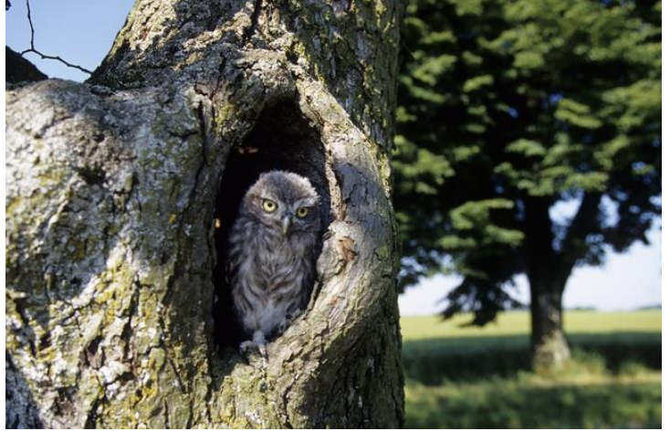
Alte Hochstamm-Obstbäume mit Höhlen sind ideale Fortpflanzungs- und Ruhestätten hessischer Steinkäuze.